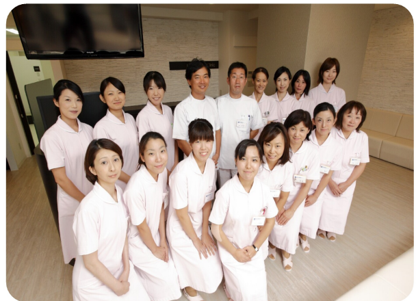
梅岡グループ スタッフ一同